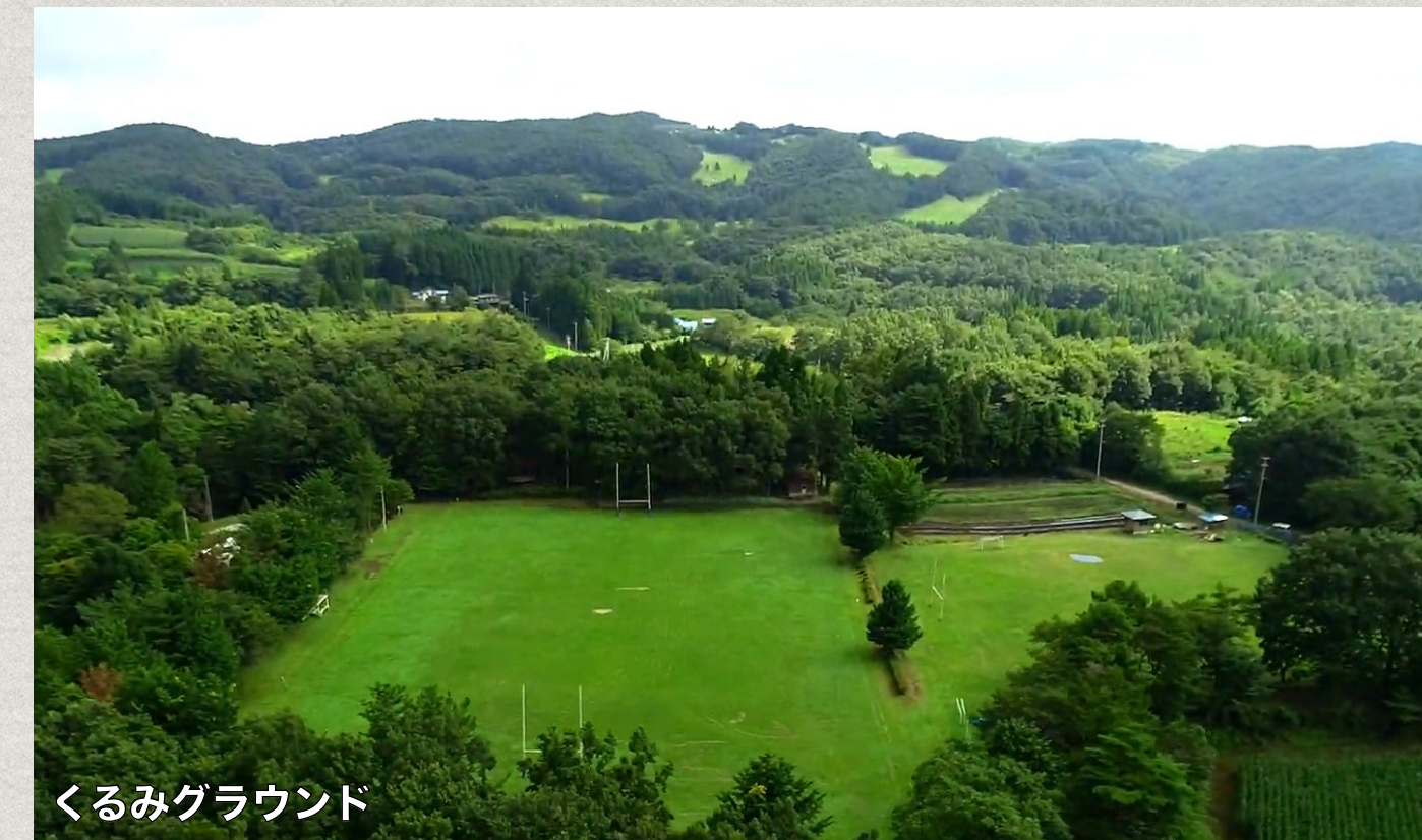
くるみグラウンド